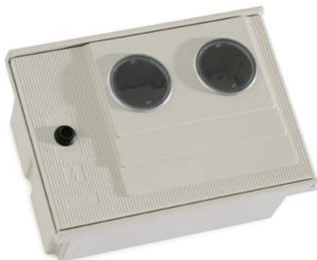
3923APM-2-2V Armário APM-2 com 2 visores

Capacidade de dissipação térmica: 31W até 118W